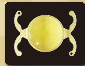
多焦点眼内レンズ

当院では世界中のあらゆる眼内レンズの移植が可能ですが、長年の臨床経験から使用するレンズを厳選しています。眼内レンズは一度移植すると簡単に交換はできません。手術前に眼内レンズコンシェルジュが時間をかけた説明を行い、それぞれの患者様に最適なレンズをアドバイス致します。